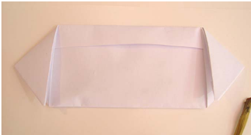
Figura 4 – Particolare della bustina

Alcuni saggi, inoltre, presentano nella parte alta del foglio una bustina (fig. 4) contenente semi e/o frutti che si sono staccati dal campione durante l'essiccazione (es. Quercus pubescens Willd. subsp. pubescens e Polygonatum multiflorum (L.) All.).