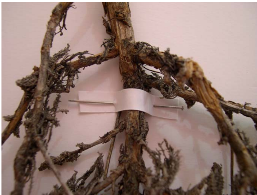
Figura 2 – Particolare del fissaggio degli exsiccata con strisciole di carta e spilli

La metodologia adottata consente una agevole rimozione dei campioni dai fogli per studi successivi e risulta estremamente gradevole alla vista. Tutti i saggi sono accompagnati da un'etichetta (fig. 3), fissata con spilli solitamente in basso a destra del foglio, riportante i seguenti dati: famiglia; specie; ambiente; località; altitudine; legit; determinavit; data.